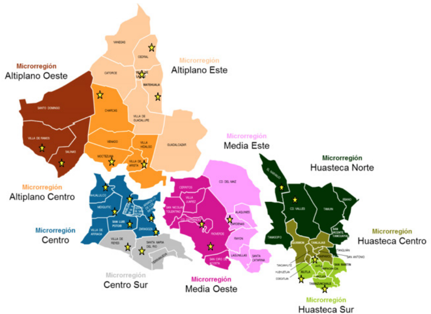
Mapa 1. Microrregiones del estado de San Luis Potosí

Al comparar el número de participantes con el número de trabajadores de la educación que laboran en el estado de San Luis Potosí, la densidad fue de 1.35 respuestas por cada 1 000 trabajadores de la educación. La zona Centro es donde se concentra la mayoría de respondientes (véase el mapa 1).